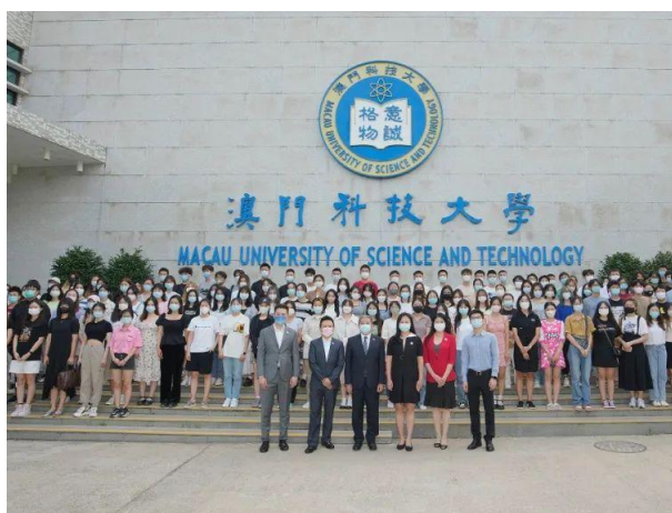
澳科大 2022 秋季学期交流生合影