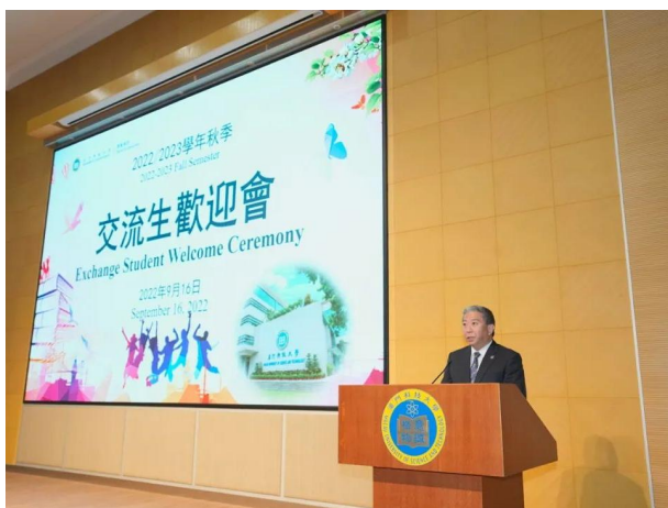
澳科大 2022 秋季学期交流生欢迎会