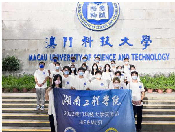
湖南工程学院赴澳科大交流生合影